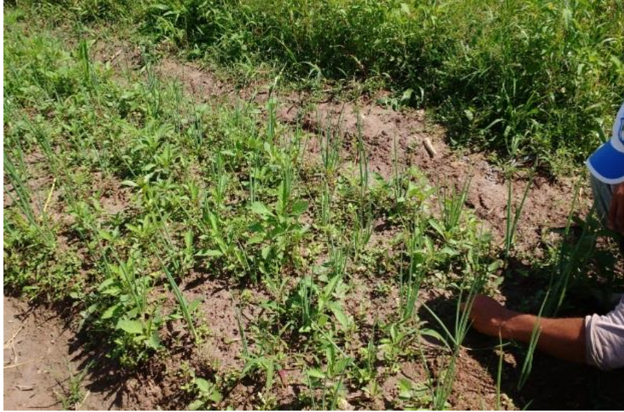
Figura 2: Cercado utilizado para a plantação de cebolinha e cheiro verde