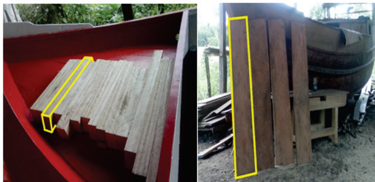
Imagem 1 - Sólido geométrico e polígono nas embarcações