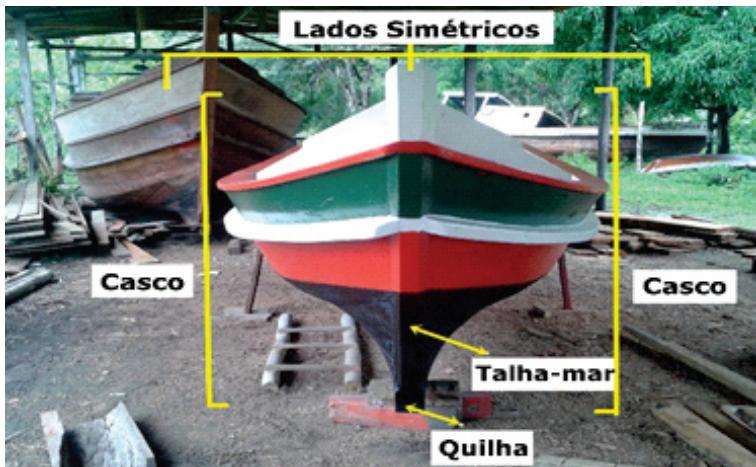
Imagem 3 - Simetria existente nas embarcações