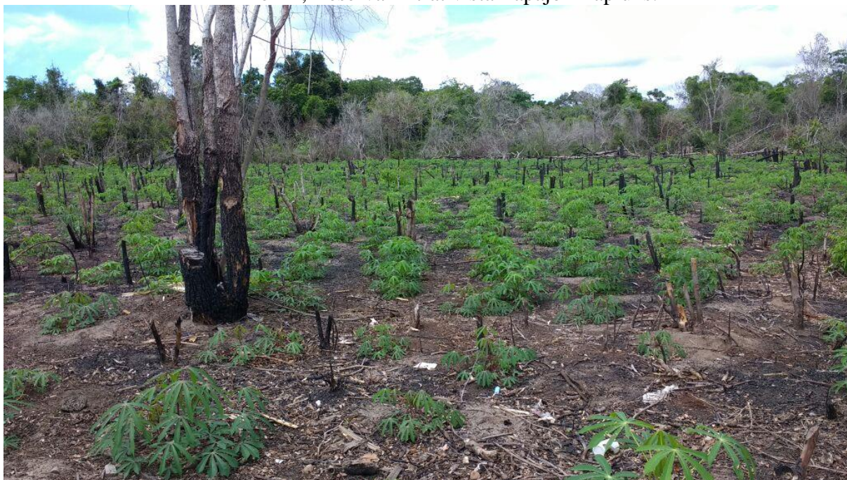
Figura 3: Área de plantio de mandioca. Ao fundo, capoeira na comunidade Cabeceira do Amorim, Reserva Extrativista Tapajó-Arapiuns.